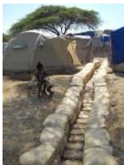
campo di petion ville

3) con vaglia postale intestato a: La Scuola di Pace – C.P. 4096, 00182 Roma Appio.