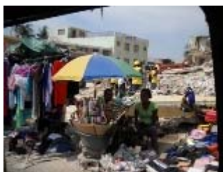
port au prince