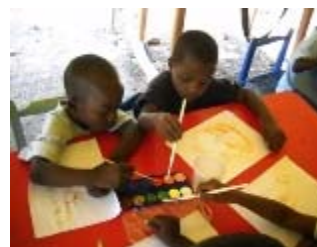
laboratorio di pittura