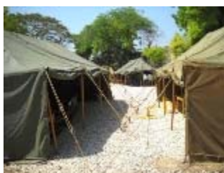
la scuola dell'emergenza