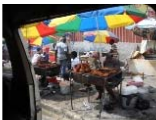
port au prince