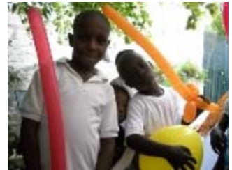
sculture di palloncini