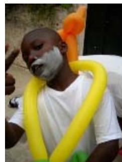
sculture di palloncini