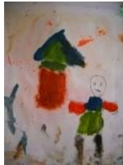
i disegni realizzati