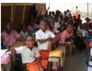
scuola sotto il tendone

3) L'Institution Mixte Splendeur di Carrefour ci ha richiesto il finanziamento per un progetto più complesso, con la costruzione di un edificio definitivo di 14 aule e per 929 mq. con un impegno finanziario previsto di circa 48.000 dollari americani.