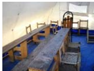
lezioni in tenda