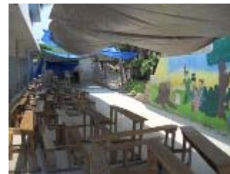
scuola jacot bleu a carrefour

2) L'Institution Mixte Beau Jardin de Jean di Leogane ci ha richiesto il finanziamento per la ricostruzione di un edificio definitivo per 11 classi, con un impegno finanziario previsto di circa 15.000 dollari americani.