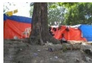
campo di petion ville

Per l'aspetto invece della continuità delle attività umanitarie in Haiti, la nostra idea è che dobbiamo favorire il più possibile una gestione autonoma delle attività stesse da parte di volontari haitiani, perché: