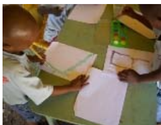
laboratorio di pittura