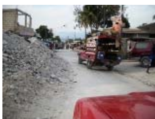
macerie in strada