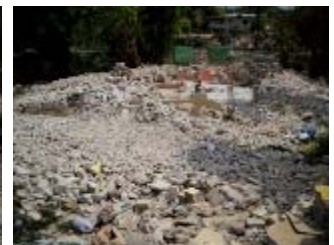
la vecchia scuola distrutta

3) L'Institution Mixte Splendeur di Carrefour ci ha richiesto il finanziamento per un progetto più complesso, con la costruzione di un edificio definitivo di 14 aule e per 929 mq. con un impegno finanziario previsto di circa 48.000 dollari americani.