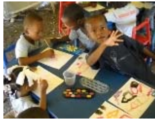
laboratorio di pittura