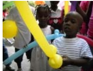
sculture di palloncini