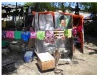
port au prince