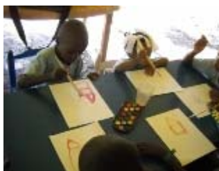
laboratorio di pittura