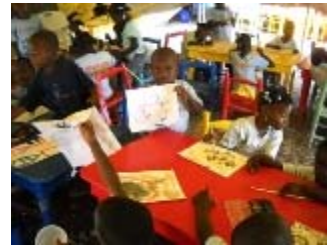
laboratorio di pittura