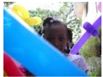
sculture di palloncini