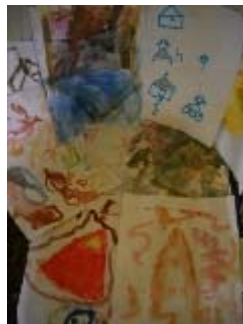
i disegni realizzati