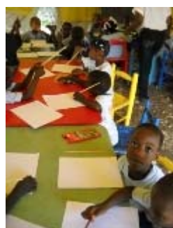
laboratorio di pittura