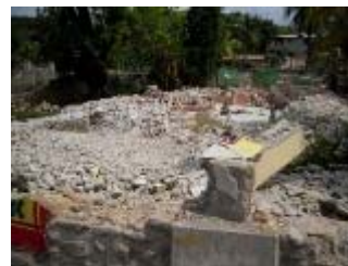
la vecchia scuola distrutta