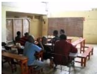
scuola di teatro a PaP