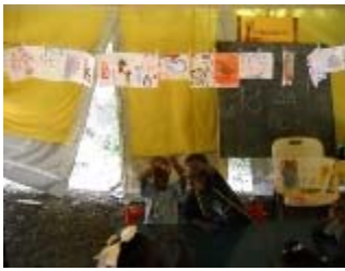
i disegni realizzati