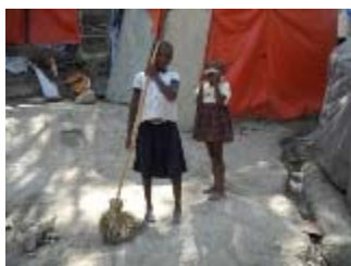
campo di petion ville