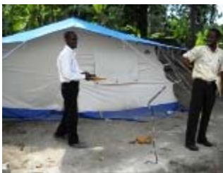
lezioni in tenda

2) L'Institution Mixte Beau Jardin de Jean di Leogane ci ha richiesto il finanziamento per la ricostruzione di un edificio definitivo per 11 classi, con un impegno finanziario previsto di circa 15.000 dollari americani.