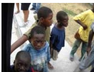
ragazzi di strada