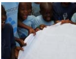
gioco il pesciolino e il mare