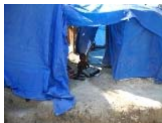
campo di petion ville