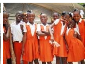
sorrisi da carrefour