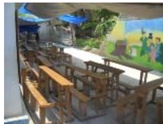
scuola jacot bleu a carrefour

1) La scuola Jacot Bleu di Carrefour ci ha richiesto il finanziamento di un modulo provvisorio per 8 classi, con un impegno finanziario previsto di circa 5.000 dollari americani.