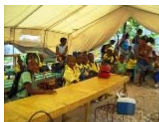
scuola sotto il tendone