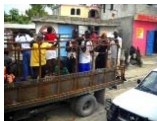
port au prince

I bambini che erano già scolarizzati sono tornati sui banchi di scuola, che sono per la maggior parte in sistemazioni d'emergenza, sotto tendoni, capannoni di lamiera, e in qualche caso anche all'aria aperta. Altri frequentano "scuole d'emergenza" nelle tendopoli allestite, dove vive la maggior parte della popolazione.