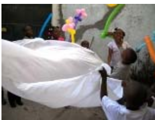
gioco il pesciolino e il mare