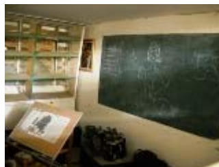
scuola di teatro a PaP