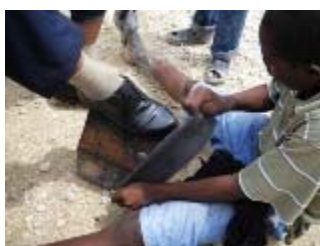
ragazzi di strada

La "fotografia" della situazione ad Haiti, a più di tre mesi dal terremoto del 12 Gennaio scorso, è desolante. Haiti, e in modo particolare la sua capitale Port au Prince, si può definire un vero "inferno in terra". Questo è una conseguenza del terremoto, ma non solo. La situazione sociale era già fortemente degradata prima ancora dell'evento sismico che ha reso ancora più apocalittica una realtà già dura. I morti sono stati seppelliti... Si calcola che siano stati circa 320.000 (quelli dell'Abruzzo moltiplicati per 1.000). I feriti della prima emergenza, stimati in circa 300.000, non sono più negli ospedali, ma le conseguenze fisiche, e soprattutto dello shock post-traumatico, oltre che delle moltissime amputazioni effettuate, saranno lunghe a passare.