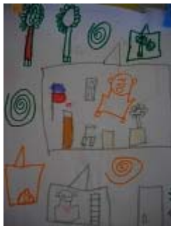
i disegni realizzati