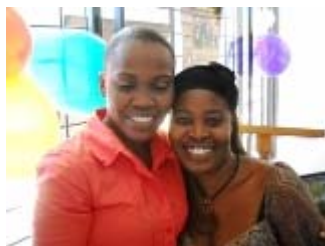
gaelle e rionne