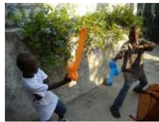
sculture di palloncini