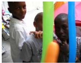
sculture di palloncini