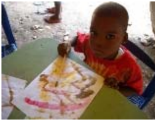
laboratorio di pittura