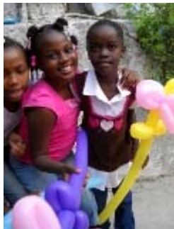
sculture di palloncini