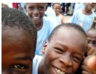
molti sorrisi da haiti