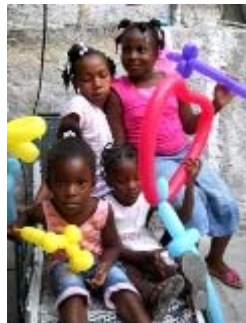
sculture di palloncini