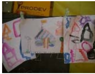
i disegni realizzati